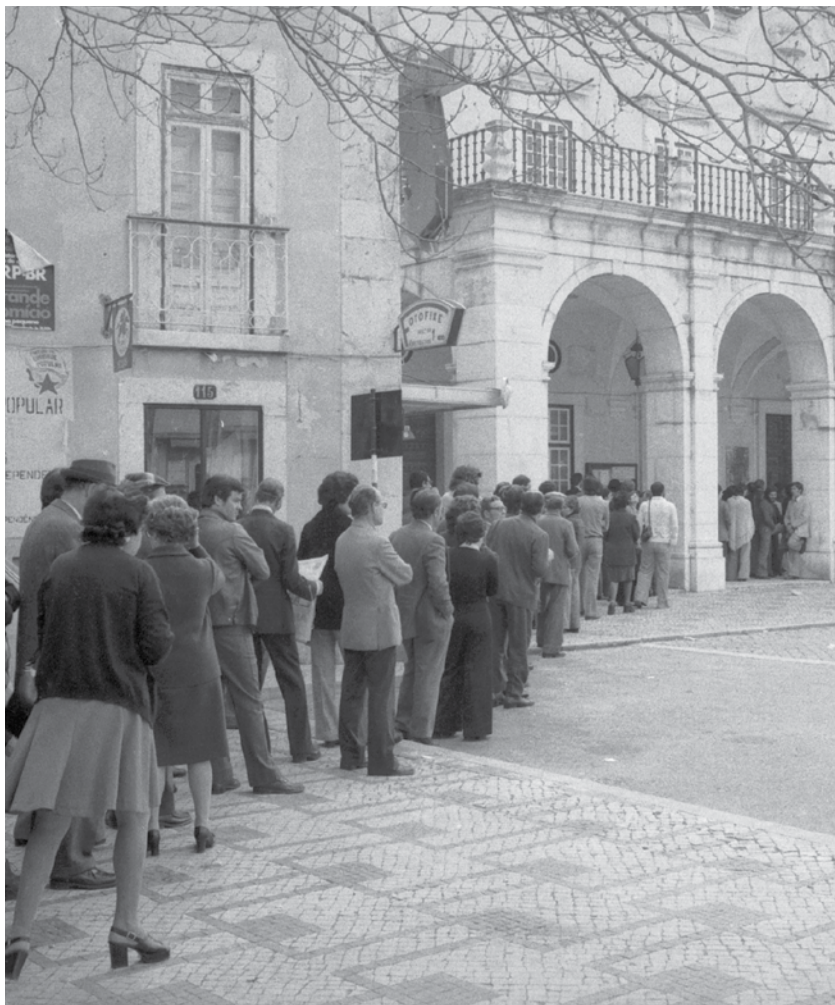
"Eleições depois do 25 de Abril – Assembleia de voto Câmara Municipal de Setúbal de 1975".