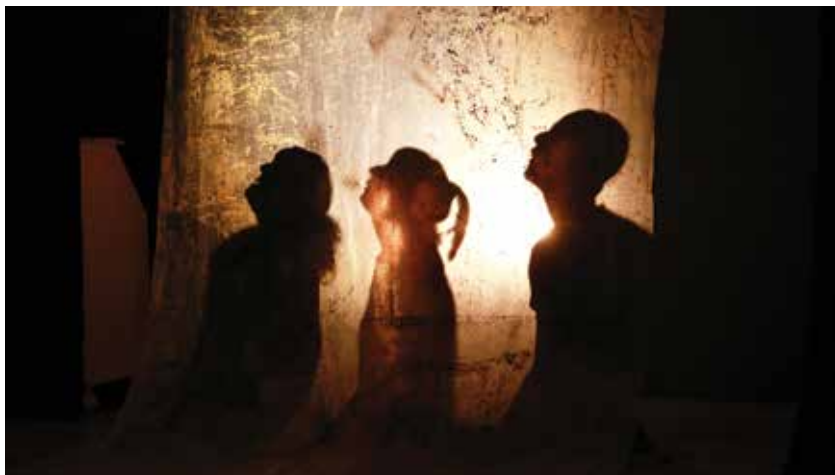
OS BARRIGAS E OS MAGRIÇOS