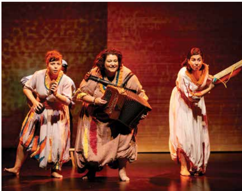
ASSIM DEVERA SER EU